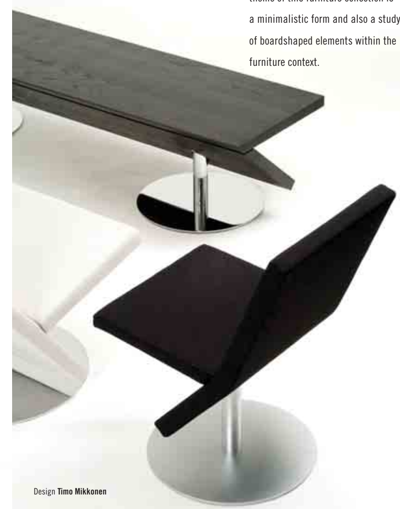
Design Timo Mikkonen

The bench completes the Noon furniture series around the same design and construction theme. The sustaining theme of this furniture collection is a minimalistic form and also a study of boardshaped elements within the furniture context.