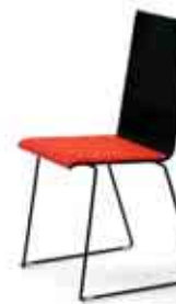
Da Capo -1/i