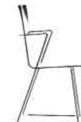
Da Capo -2/p