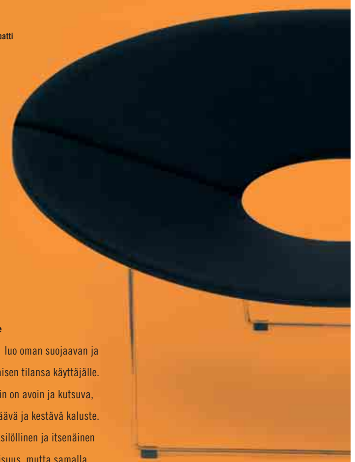
Design Timo Ripatti