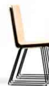
Da Capo - 1/P