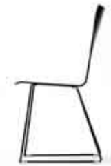
Da Capo -1/p