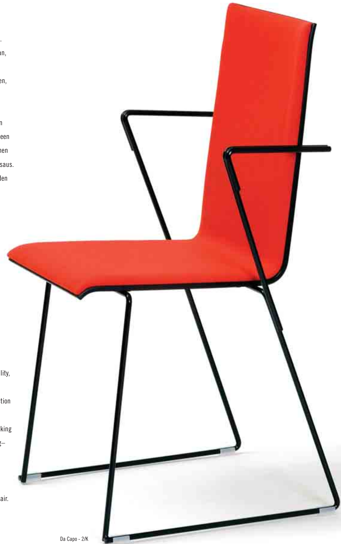
Da Capo - 2/K

DaCapo – from the beginning as the music term goes. Again, evaluation of applicability, ergonomics, comfort, serial thinking, construction, production orientation, appearance, durability, transportation, packing and costs. From the beginning – once again. Concentration on the essentials, deleting the unnecessary. Achieving the eternal beauty of the small chair. DaCapo – a light small chair.